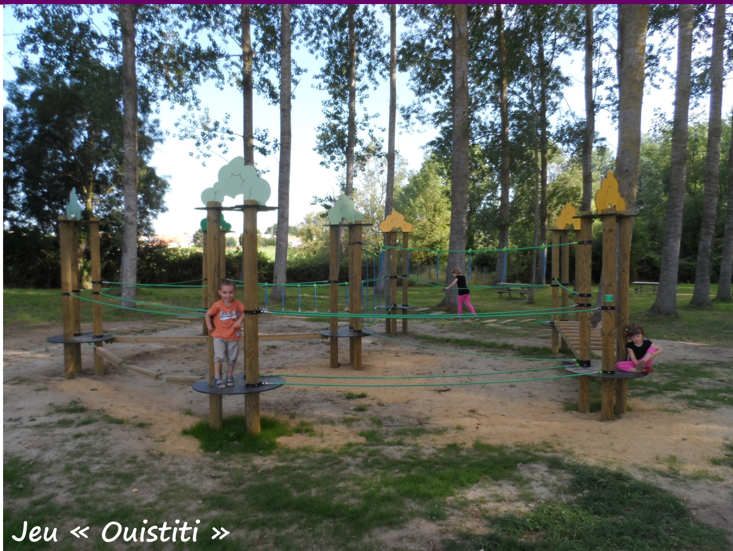
Jeu « Ouistiti »

La Municipalité de Commequiers a mis en place une aire de jeux pour les enfants, ainsi que des tables de pique-nique ; un espace très agréable et apprécié par les petits comme les grands !